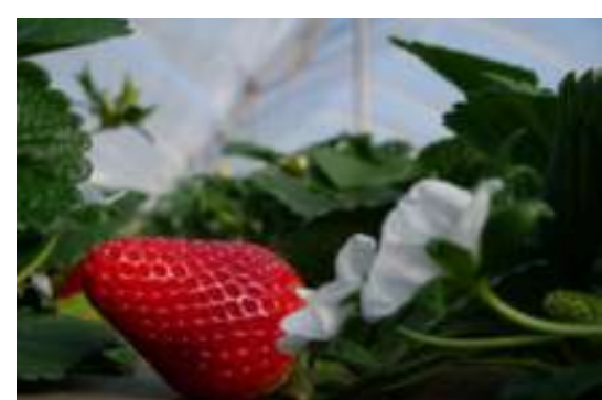
Nova Siri Genetics: il mercato della fragola chiede varietà precoci