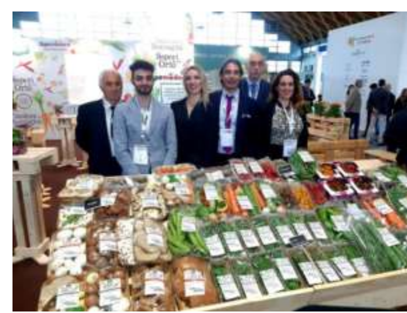
Sipo, stand Macfrut