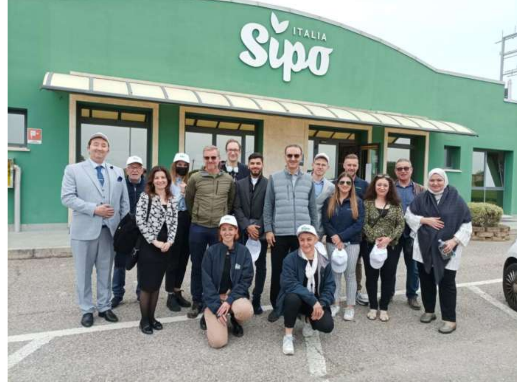
Vista guidata allo stabilimento Sipo

Successo oltre le aspettative in chiave export quello che ha caratterizzato la partecipazione di Sipo a Macfrut .