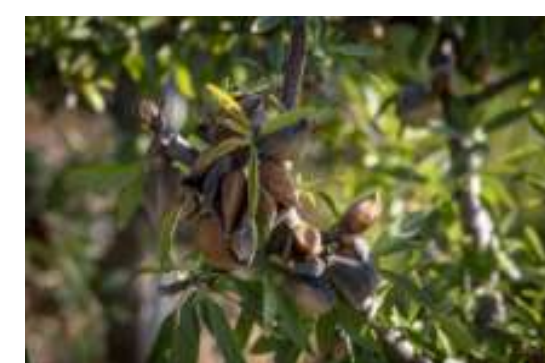
Veracruz Almonds, un piano di investimenti di 50 milioni di euro