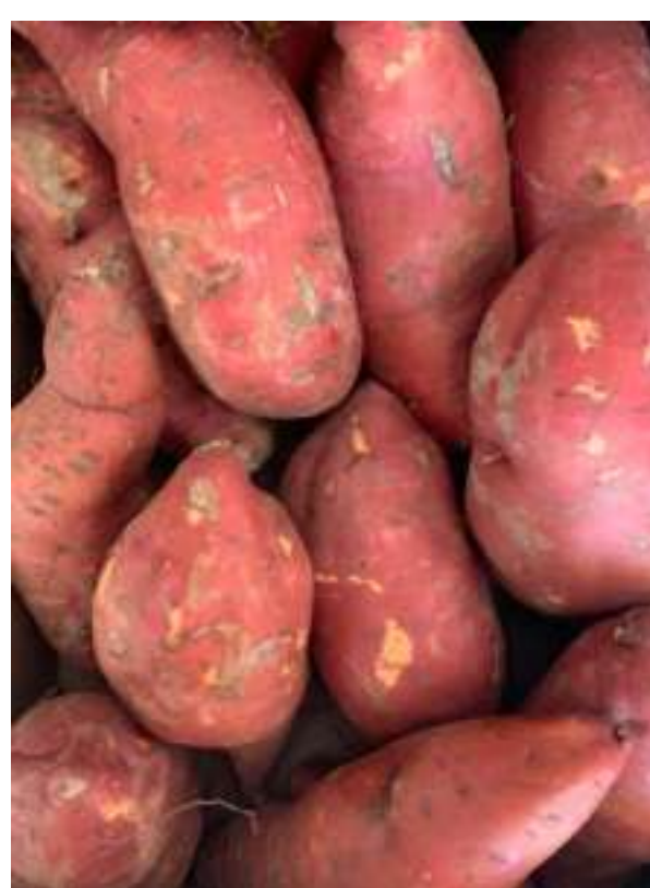
La patata dolce è un superalimento

La patata dolce è un rizotubero , cioè una radice secondaria. Dal punto di vista nutrizionale è molto ricercata ed è considerata un superfood grazie agli innumerevoli benefici che apporta. In particolare si caratterizza per il basso indice glicemico (a differenza della patata tradizionale) e ridotto apporto calorico . In più ha un'elevata presenza di betacarotene , un carotenoide con potenti proprietà antinfiammatorie e antiossidanti.