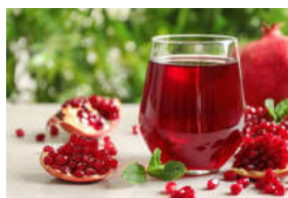
La melagrana tra i frutti più performanti degli ultimi dieci anni