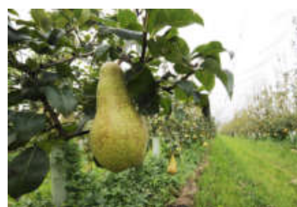
Oi Pera, numeri produttivi al minimo storico