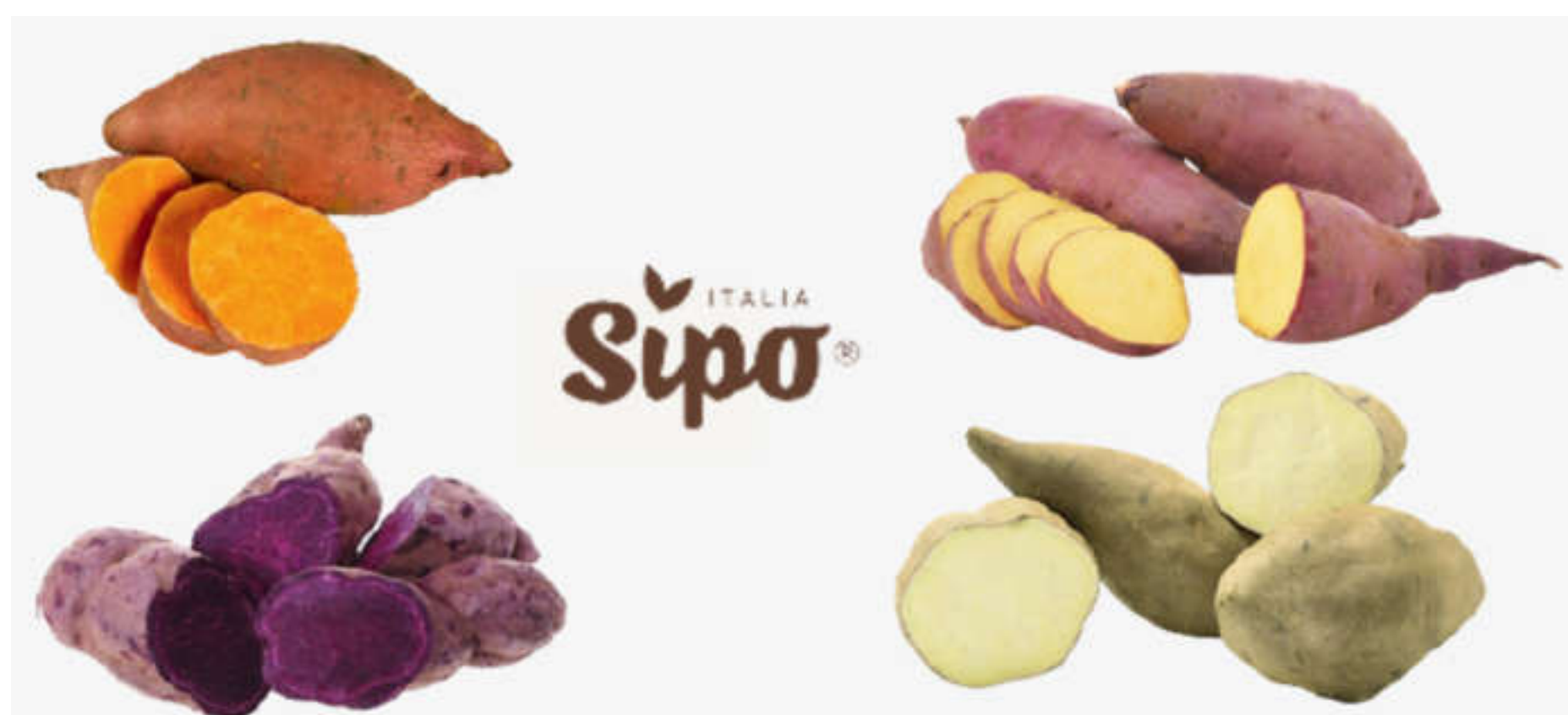
La nuova linea di patate dolci Sipo

Arrivano le Patate Dolci Sipo , un prodotto healthy : la campagna partirà sabato 16 ottobre a partire da tre insegne dove verranno distribuite. Prosegue la segmentazione dell'offerta dell'azienda romagnola.