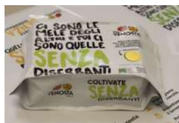
Vip Val Venosta, un nuovo innovativo packaging compostabile