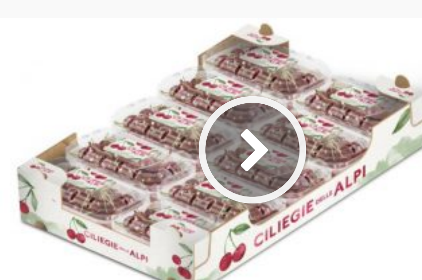
Vog amplia l'assortimento e lancia le ciliegie delle Alpi