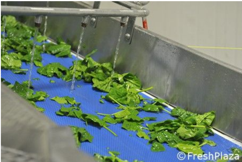
Fase di lavaggio degli spinaci destinati alla